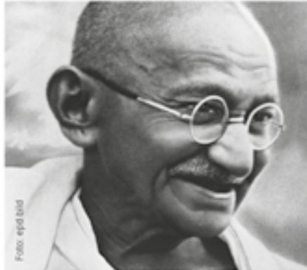
Mahatma Gandhi wurde am 2.10.1869 in Porbandar (Indien) geboren und 1948 bei einem Attentat getötet.

Der hinduistische Begriff Ahimsa, Gewaltfreiheit, bedeutet nicht einfach Verzicht auf Gegenwehr. Gemeint ist Gewaltlosigkeit